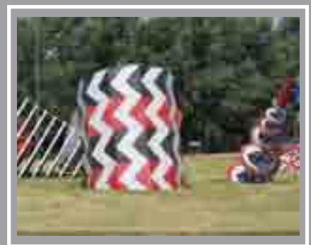
Tirnod Cylchdro Ffordd Windsor Pierre Vivant, 1992