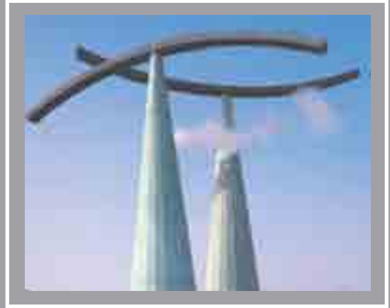
Gorsaf Gyfrinachol Ffordd Rover Ellis O'Connell, 1992