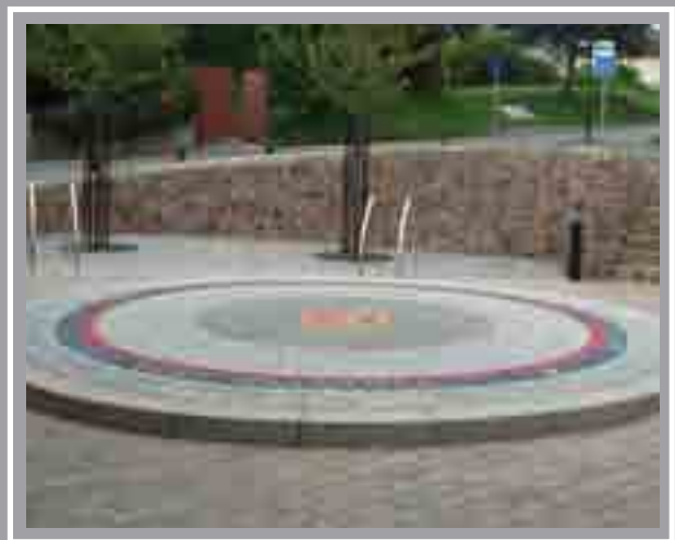
Siopau High Corner Pentyrch 2004