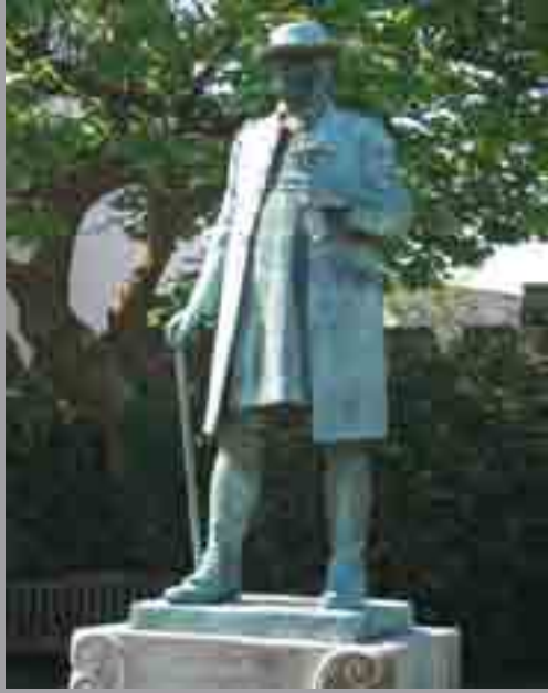
Cerflun Archddiacon Buckley Lawnt y Gadeirlan, Llandaf William Goscombe John, 1926