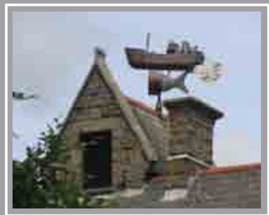
Ceiliog y Gwynt ar Long Fasnach Bwyty Woods, Stryd Stuart Andy Hazell, 1997