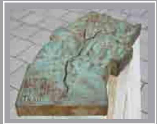
Map tirwedd Llwybr y Taf Gyferbyn ag Adeilad Pen Pier, Bae Caerdydd 1996