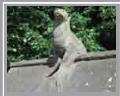
Mur yr Anifeiliaid Castell Caerdydd, Stryd y Castell Thomas Nicolls ac Alexander Carrick, 1888 ac 1931