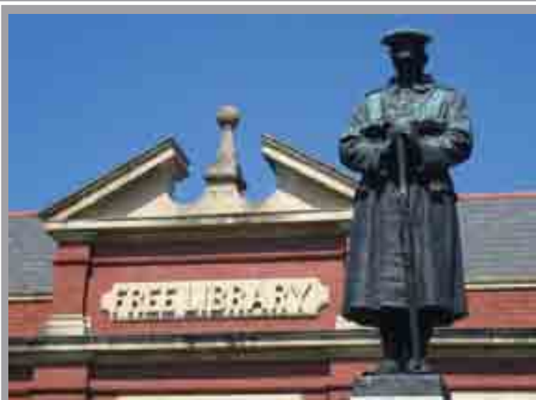
Cofeb Ryfel yr Eglwys Newydd Llyfrgell yr Eglwys Newydd, Stryd y Parc Circa 1920