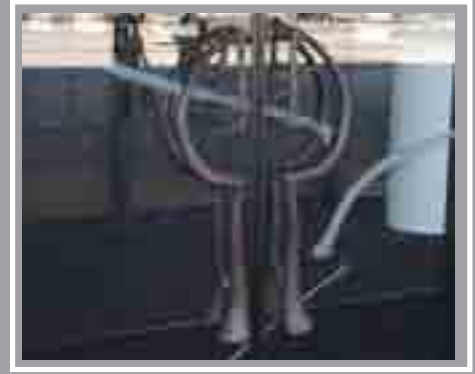
Celfi Drws Canolfan Mileniwm Cymru, Bae Caerdydd, 2005