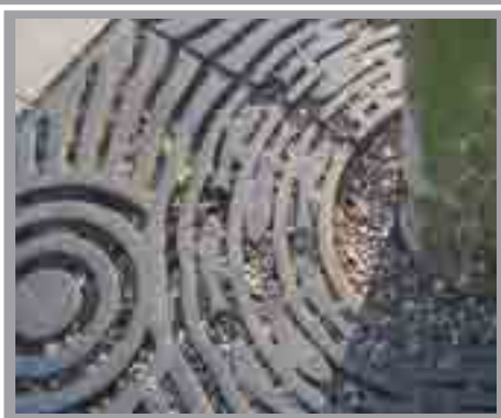
Rhwyllau Coed Lôn y Felin, Canol y Ddinas 1995