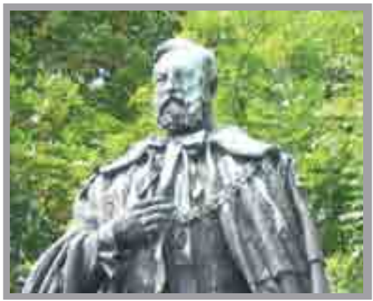
Cerflun Trydydd Ardalydd Bute Gerddi'r Brodyr, Cathays P. Macgillivray, 1930