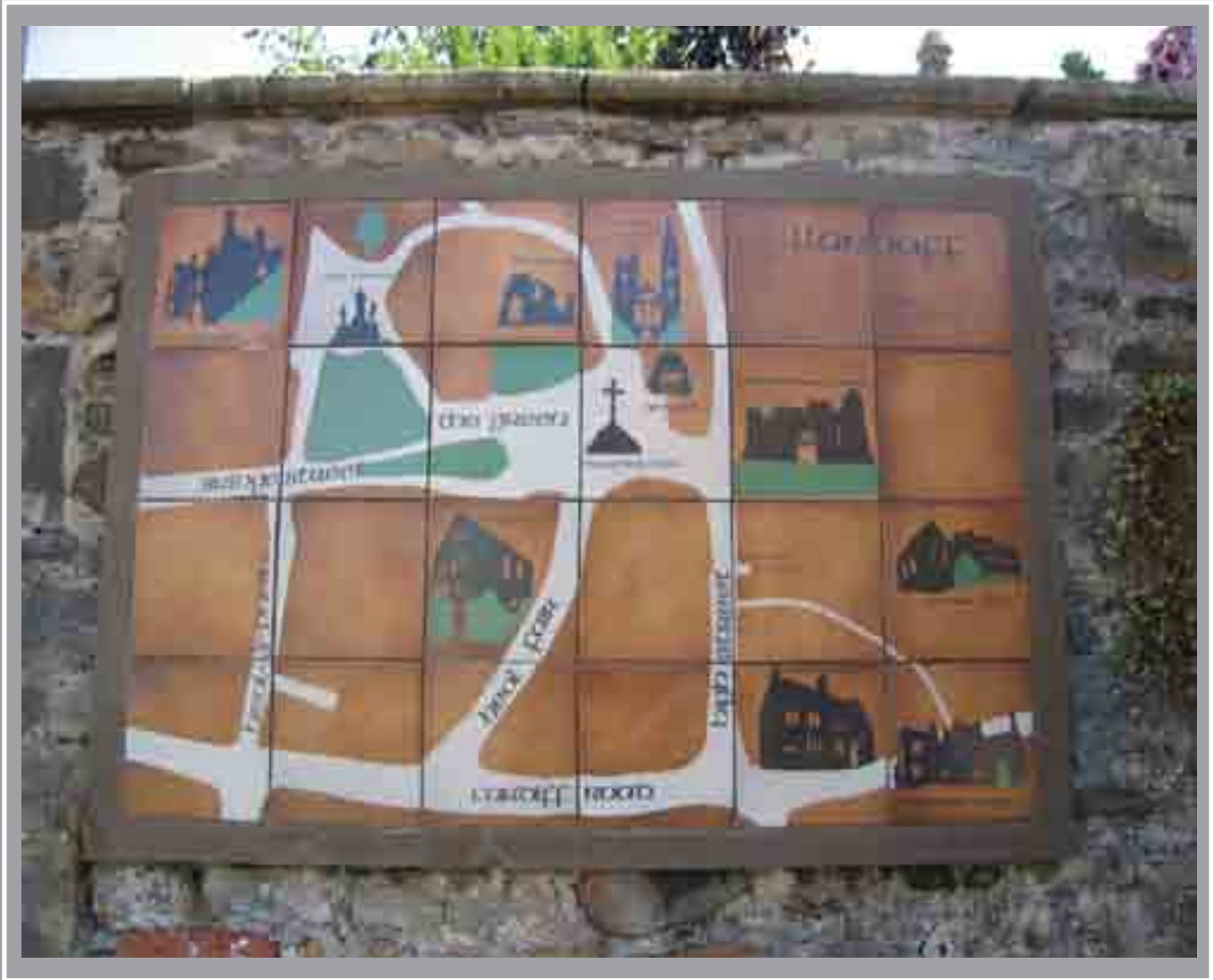
Map o Landaf Stryd Fawr, Llandaf Angela Davies, 1981