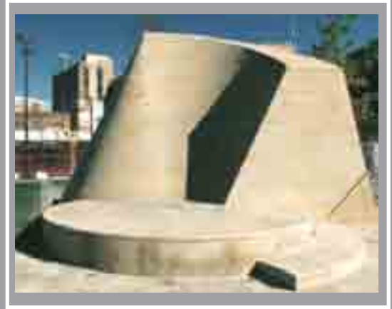
Cader Idris Sgwâr Canolog, Gorsaf Caerdydd Canolog William Pye, 1999