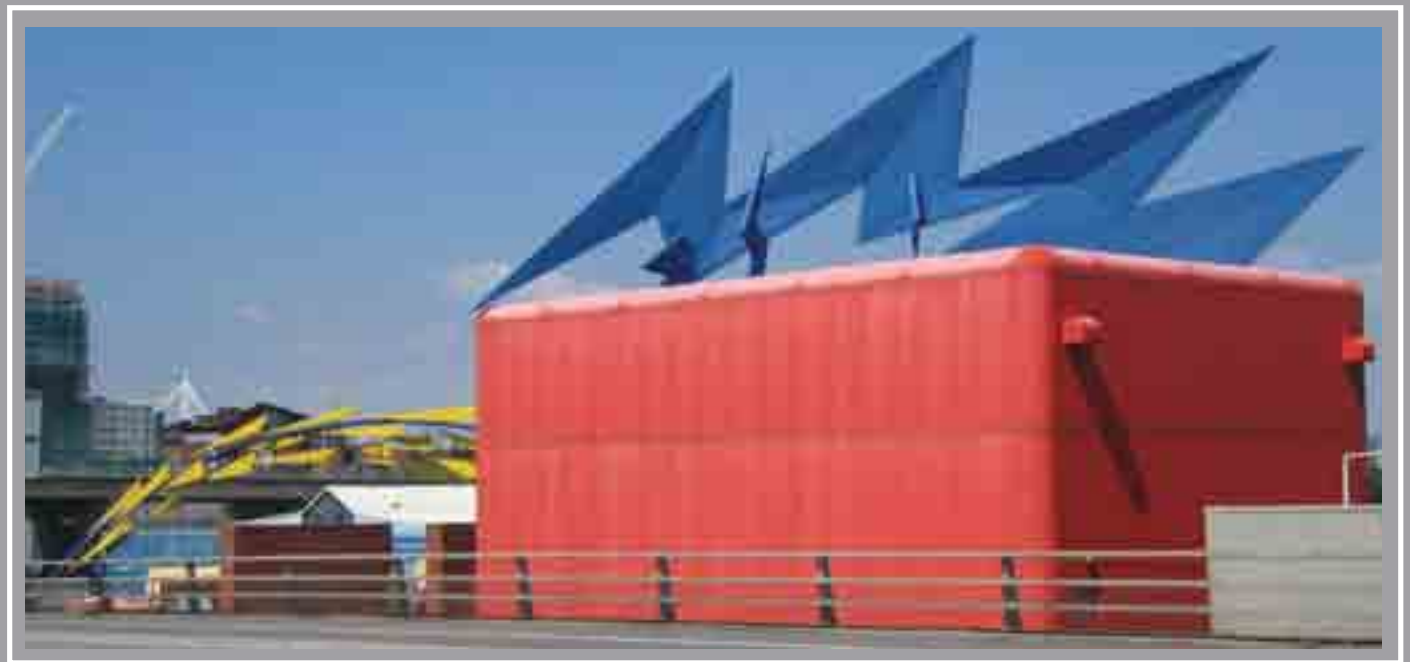
Fflach Las, Blwch Egni a Sglodion Meinwe Stryd Tyndall John Gingell, 1994