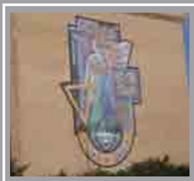
Llys yr Ynadon, Fitzalan Place, Canol y Ddinas