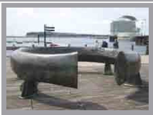
Cylch Celtaidd Roald Dahl Plass, Bae Caerdydd Harvey Hood, 1993