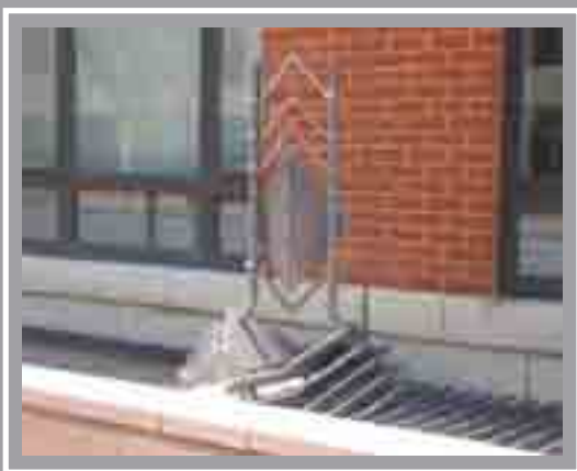
Rhwyllau Stryd Cynulliad Cenedlaethol Cymru, Stryd Pen Pier Alan Evans, 1993