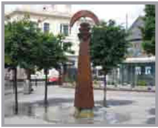
Nodwedd Ddŵr Sgwâr Landsea Cei'r Forforwyn, Bae Caerdydd 2000