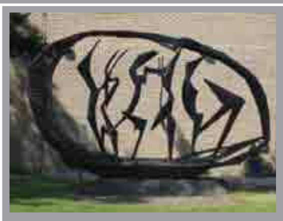
Awen Coleg Cerdd a Drama Cymru, Ffordd y Gogledd Charles l'Anson, 1975