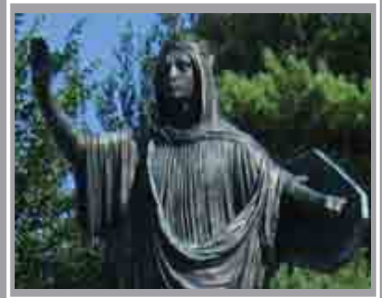
Cofeb Ryfel Llandaf Lawnt y Gadeirlan, Llandaf William Goscombe John, 1924