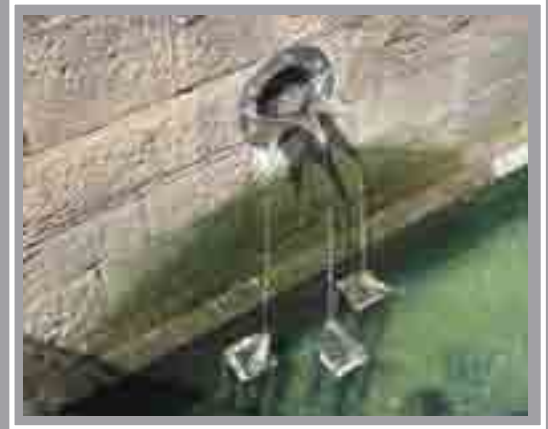
Nodwedd Ddŵr Mynedfa i Roald Dahl Plass, Bae Caerdydd