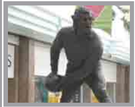
Cerflun Gareth Edwards Canolfan Dewi Sant, Canol y Ddinas Bonar Dunlop, 1982