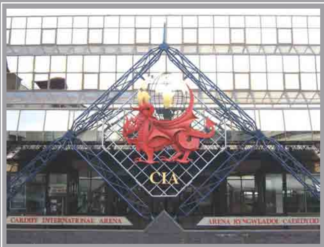
Arena Ryngwladol Caerdydd Stryd Mary Ann, Canol y Ddinas