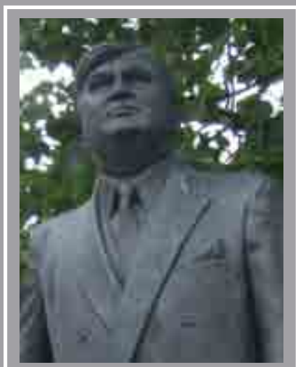
Cerflun Aneurin Bevan Stryd y Frenhines, Canol y Ddinas Robert Thomas, 1987