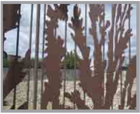
Porth Caerdydd Arglawdd y Rheilffordd, Adamsdown Jane Kelly, 1997