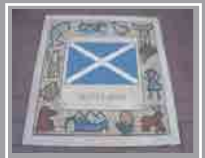
Rhodfa'r Mileniwm Gyferbyn â Stadiwm y Mileniwm Stadiwm, Canol y Ddinas