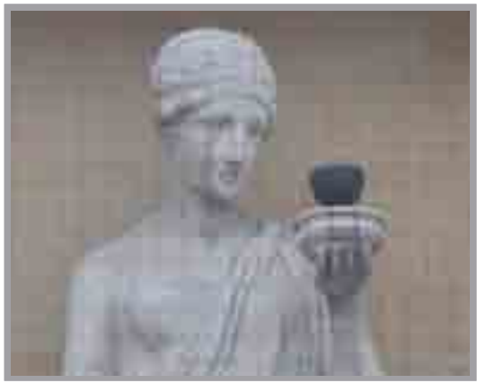
Cerflun o Ferch Roegaidd Prince of Wales, Heol Fair Circa 1920