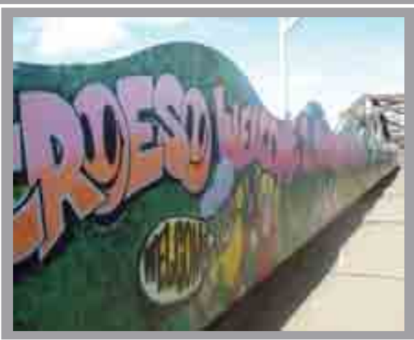
Y Bont Ddu Rhodfa'r Rheilffordd, Adamsdown 2004