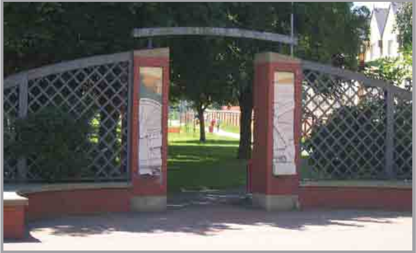
Mynedfa Parc y Gamlas Stryd James, Butetown