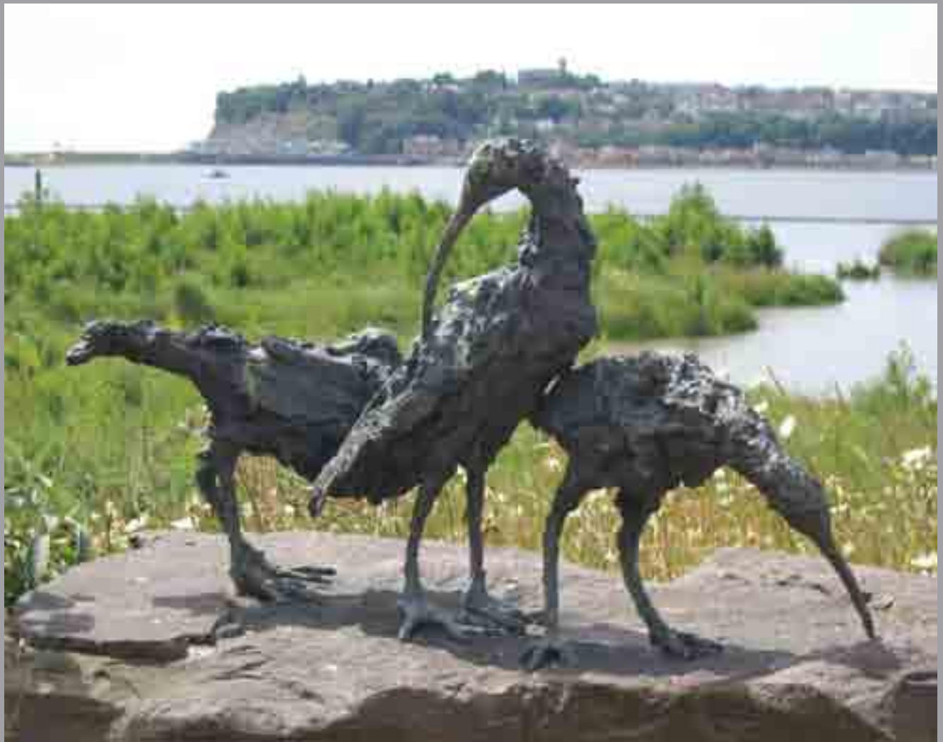
Llif y Gylfinirod Gwesty a Sba Dewi Sant, Stryd Havannah Sally Matthews, 2000