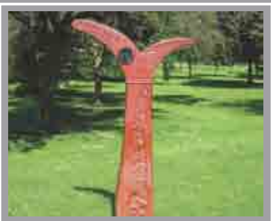
Mynegbost Milltir Rhwydwaith Cenedlaethol Ledled Caerdydd (Enghraifft o Barc Bute) Jon Mills