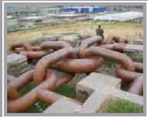
Cysylltiadau Mud Parc Cymunedol Grangemore, Ferry Road Ian Randall, 2000