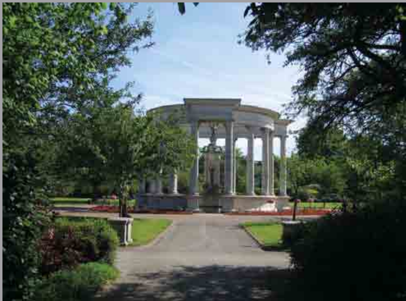
Cofeb Ryfel Cenedlaethol Cymru Gerddi Alexandra A. Bertram Pegram, 1928