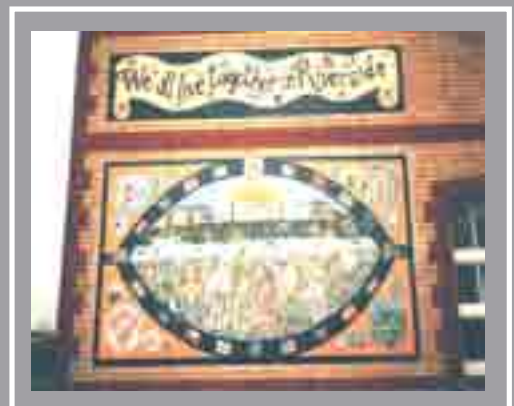
Murlun Brithwaith Ysgol Ffordd Kitchener Ffordd Kitchener