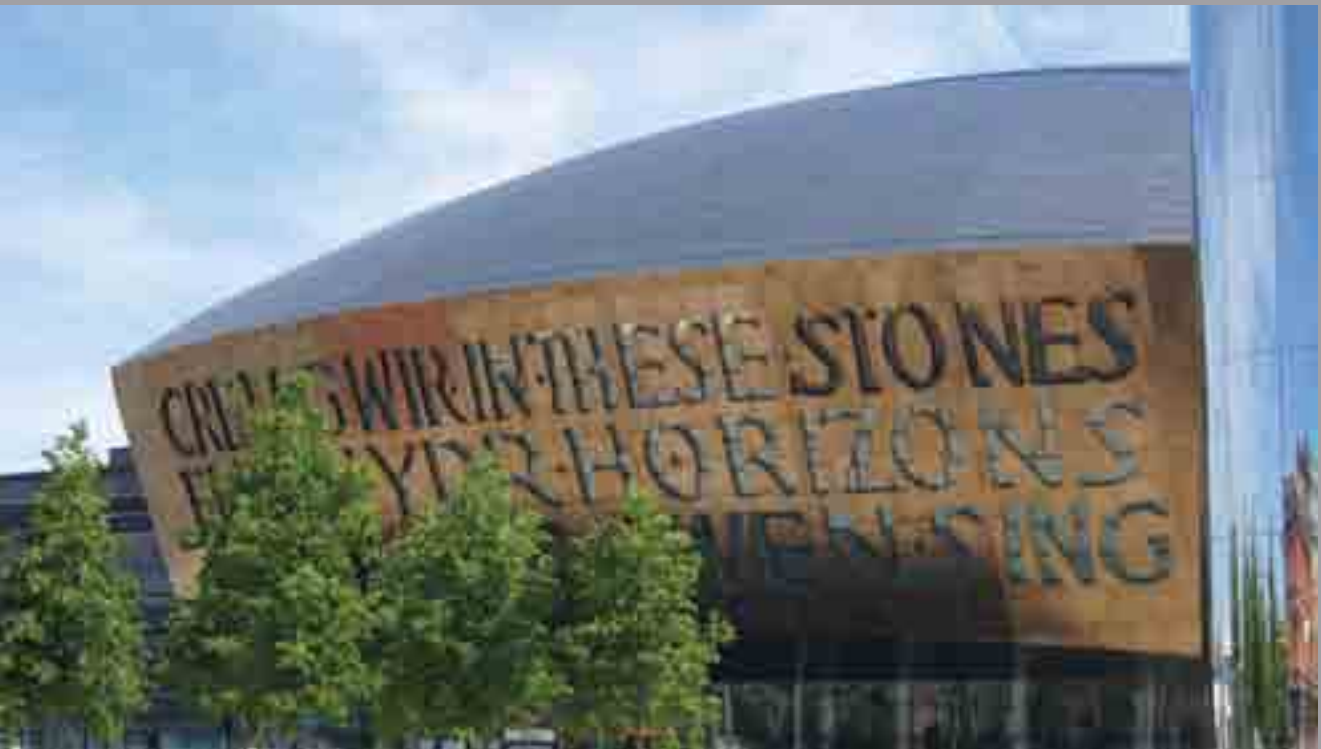
Canolfan Mileniwm Cymru Roald Dahl Plass, Bae Caerdydd 2005