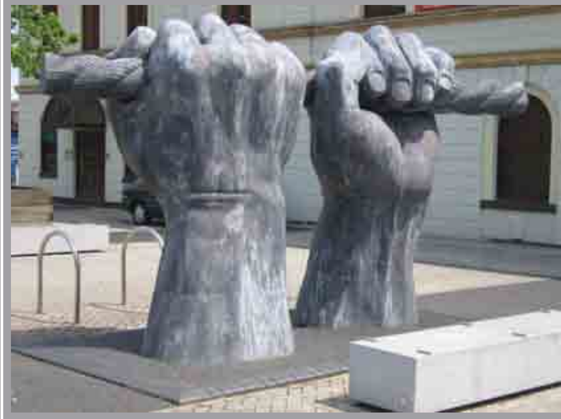
Llwythi, Stryd Stuart, Cei'r Forforwyn , Brian Fell, 2000