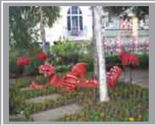
Y Ddraig ar ei Thraed Gardd Orffwys Sant Ioan, Stryd Working 2004