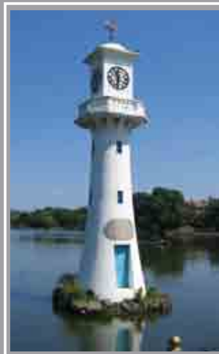
Cofeb Scott Llyn Parc y Rhath 1915