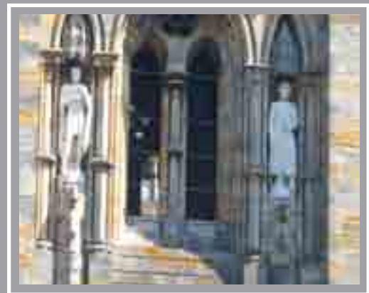
Cadeirlan Llandaf Lawnt y Gadeirlan, Llandaf