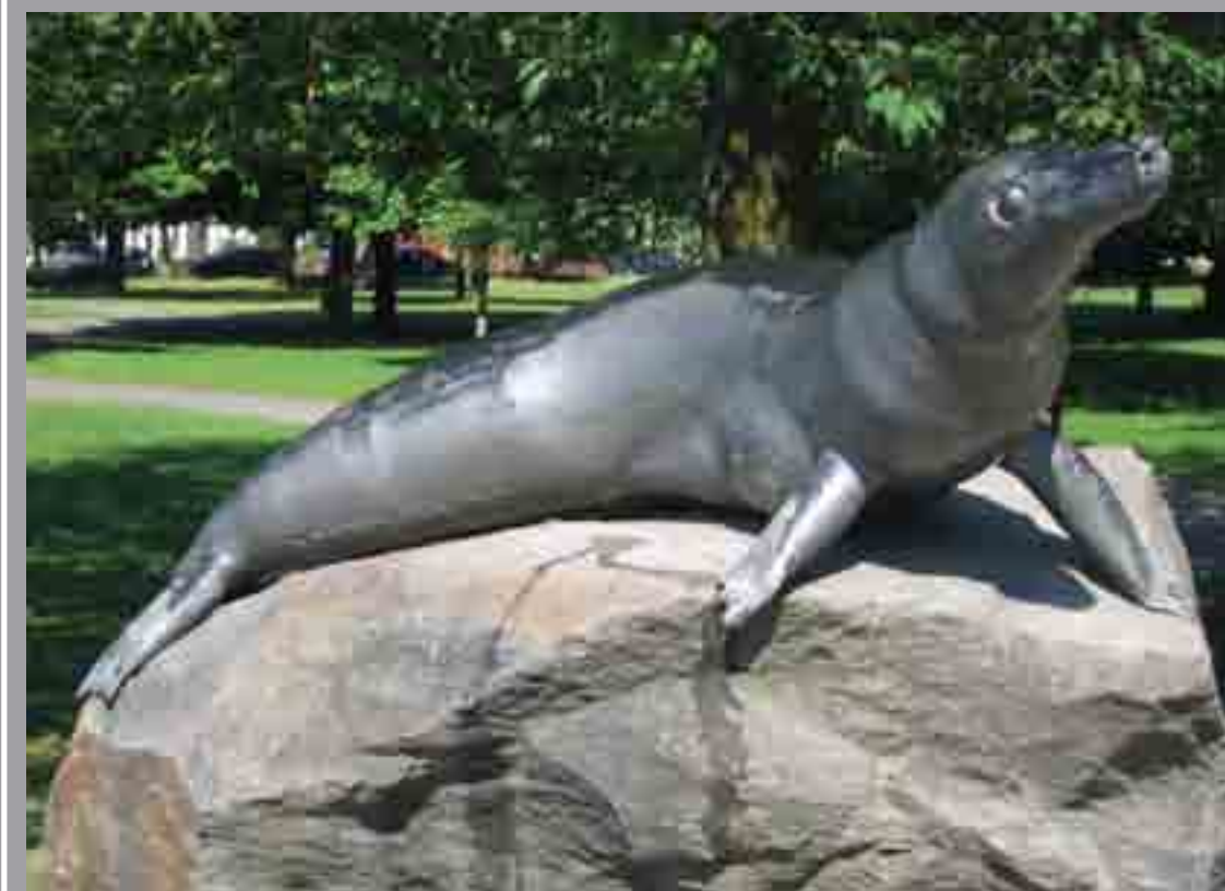
"Billy the Seal", Parc Victoria, Heol Parc Victoria, David Peterson, 1997