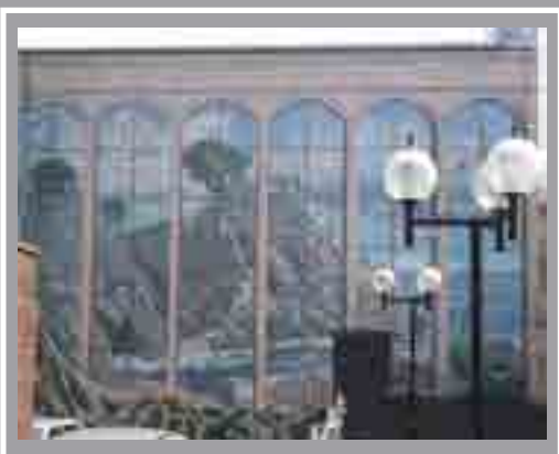
Undeb y Gweithwyr Siopau, Dosbarthu a Gwaith Perthynol Rhodfa'r Gadeirlan, Canol y Ddinas