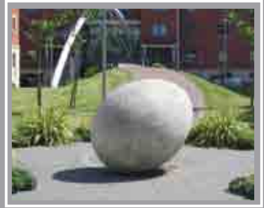
Yr Wy Mawr Cwrt Henke, Ffordd Schooner Rachel Joynt